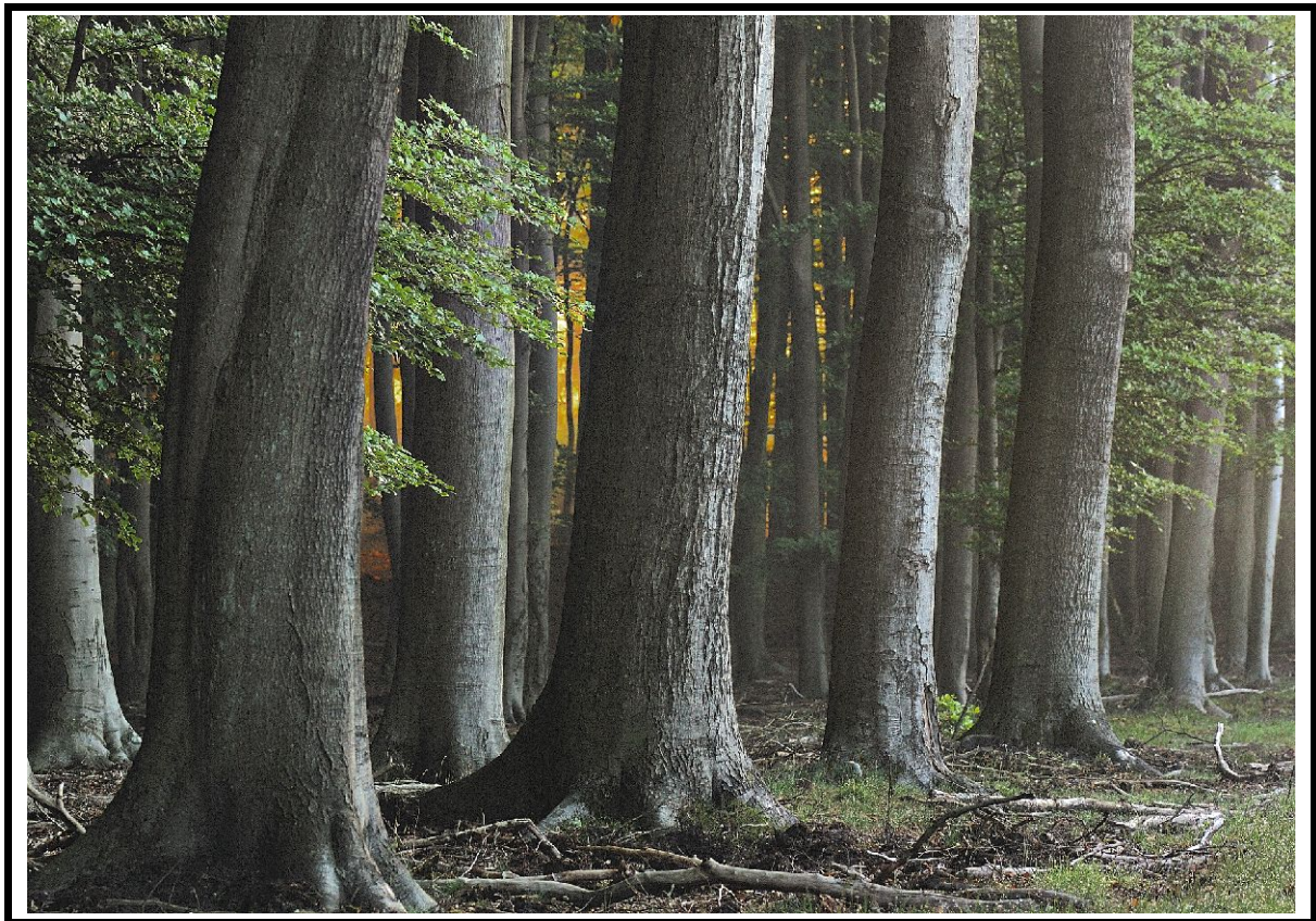
beukenbos in vroege-ochtendlicht

kort verslag samengesteld door R.C.L. Versteeg